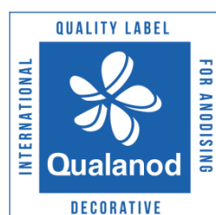
g) Ejemplo del uso de la etiqueta de la marca con texto adicional, según se requiera