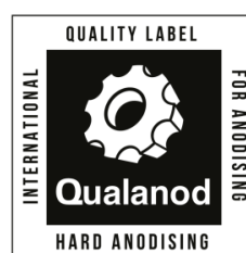
e) Ejemplo de la etiqueta de la marca en blanco y negro