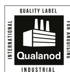
h) Ejemplo donde el recuadro interior de la etiqueta se estampa o se imprime directamente sobre cinta o en pegatinas adhesivas

PEARY LTD OPEX STREET ANNATOWN RESPUBLICIA